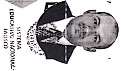
SISTEMA EDUCATIVO NACIONAL JALISCO

En virtud de haber acreditado los conocimientos, habilidades y destrezas conforme a el